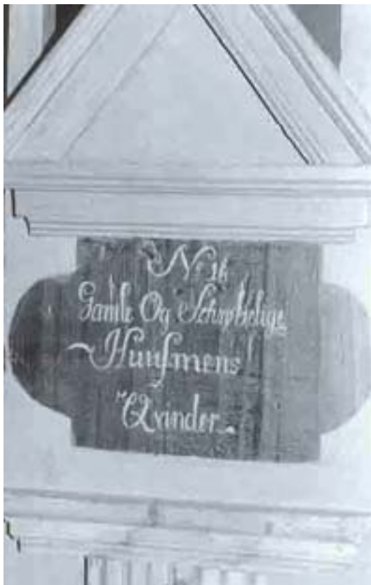
Benk nr.16. Gamle og Schrøblige Husmens Quinder.

Vinteren og våren 1854 var det innbrudd på Oppegård, Bøhler, Teltboden, på Tukkebøl to ganger, Østenbøl og Støttum. Lensmannen undersøkte vidt og bredt uten å finne noe. Dette året var kallet presteløst og ble betjent av og til av naboprester. I slutten av mai forrettet pastor