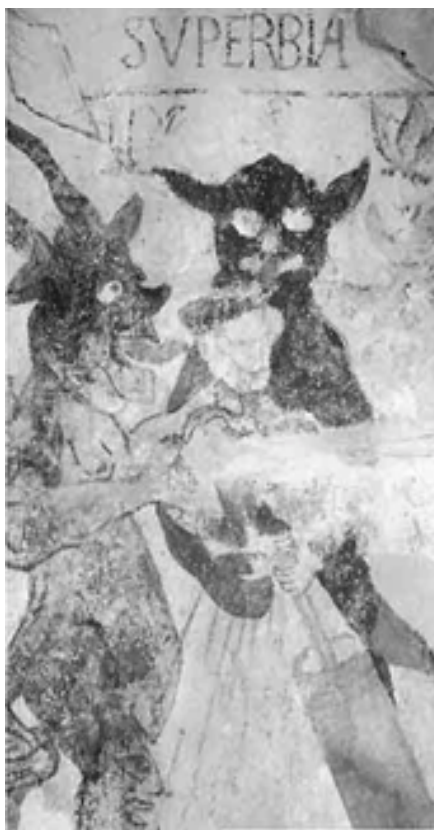
Kalkmaleri fra Enebakke kirke.

men gitt av danske embetsmenn. Nedenfor og øst for hovedbygningen, i havnehagen, er det en stor, litt oval oppkastet haug. Den var ikke bevokst med trær den tiden jeg bodde på Krogsbøl, fra 1859-66.