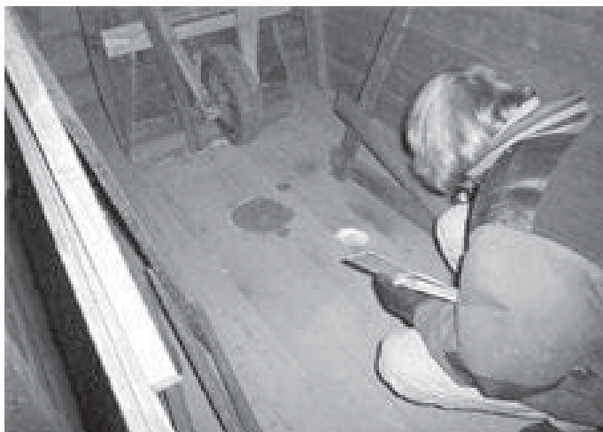
Konservatoren oppdager sopp i stall-låven fra Døli.

selv om han nok hadde vært klar over at tilstanden ikke hadde vært den beste. Og midt i “Romerikstunet” en hovedbygning fra Trøgstad i Østfold. Heldig vis i noe bedre stand enn de andre husene, men det hjelper jo ikke oss romerikinger. En liten “konferanse” med konservator etter befaringen utløste et felles ønske om å gjøre noe. Han kunne fortelle at det i årevis hadde foreligget planer om flytting av Trøgstadhuset og gjenskaping av et fullstendig “Romerikstun” med den lagrede Garsvikbygningen i sentrum. Dessuten skulle nok et lagret hus fra Romerike, et stabbur fra Engelstad i Nannestad, settes opp.