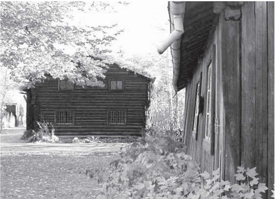
Smestadstua fra Gjerdrum og pottemakeriet fra Norum i Nes

Vi startet med Smestadstua fra Gjerdrum, Romerikes stolthet på Folkemuseet. Hust bar preg av å ha stått avstengt en tid. Noe som lignet grovt mel fra veggene fanget straks oppmerksomheten, et tydelig tegn på at småkryp var i ferd med å forsyne seg vel av