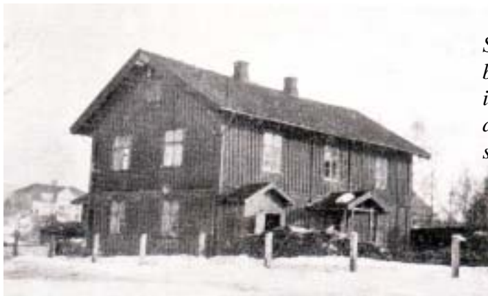
Saugdalen bruksskole ble i 1889 overtatt av Skedsmo skolevesen.

Fredsdagene i mai glemmer jeg aldri. Vi hadde lite skole, og fikk gå i 17. mai tog for første gang. I gudstjenesten var vi litt stolte, for en fra klassen sang “Norge mitt Norge”.