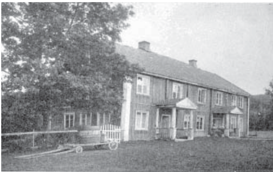
Garsvikbygningen slik den var.

Ikke rart at denne låven aldri er åpen for publikum !