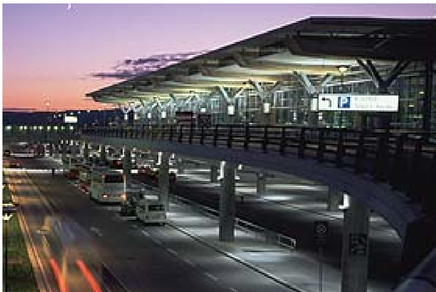
Gardermoen i dag.

helt ny veg “over skauen” fra Lunner til Gardermoen. Det er imidlertid ikke utenkelig at prosjektet vil kunne se dagens lys en gang i framtida når presset fra eksisterende og framtidige befolkningskonsentrasjoner i søndre del av Nittedal og tilliggende områder krever en bedre vegforbindelse - både mot Oslo og mot Gardermoen.