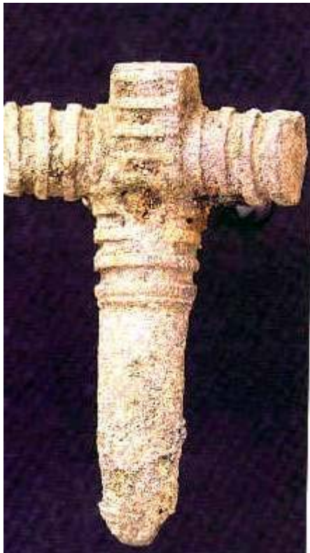
Dette er en bronsespenne fra 300-500 etter Kristus. Den ble funnet i en grav under forarbeidet til Gardermoen.

ligger en gravhaug og en steintuft i tilknytning til denne traseen. Mellom Lahaugmoen og Skedsmovollen er fergestedet Nitsund og en kjerrevei over Brånåsen de mest autentiske bevarte deler av veilenken. Veiens kvalitet underbygges av at det på Brånås finnes en åsrøys og