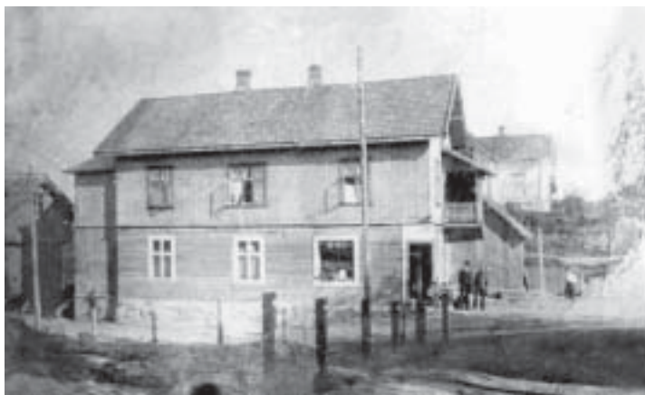
Sørumsand Handels forenings bygning ca.1914. Bygningen brant 1926. Noe av stabburet ses også på bildet.