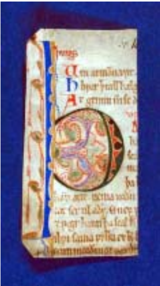
Fra Frosta- tings- loven. Avskrift fra 1220- 1250

Magnus Lagabøters Landslov (1274) fastslår at veien skal ligge som den alltid har gjort, men veien er ikke ytterligere beskrevet. Først med gruveriften tidlig på 1400/1500 tallet med tilførselsveier til verkene som foredlet malmen kan vi regne med at det ble bygget veier for tungtransport utenfor middelalderbyene. I Nittedal på strekningen mellom Hakadalsverk og Grua er det bevart levninger etter en slik vei.