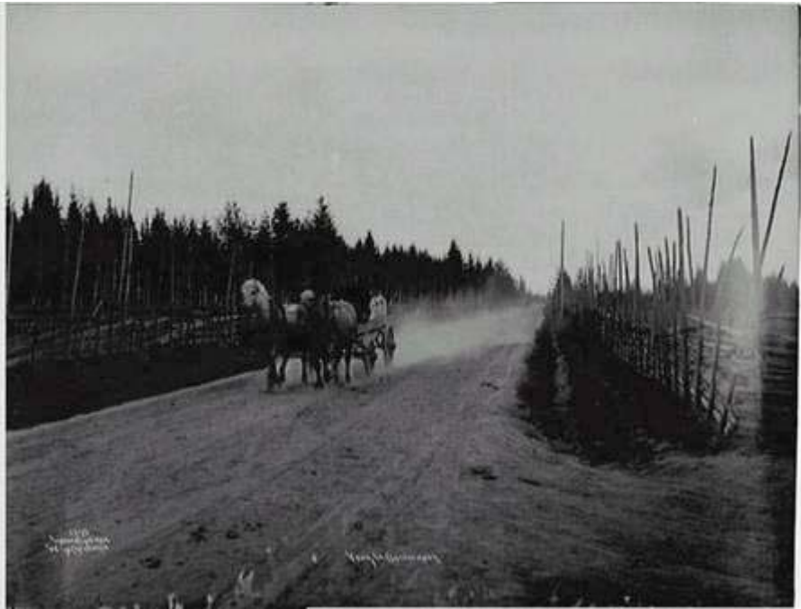
Ullensaker. Veien til Gardermoen 10/6 1904

et gravfelt som skal bestå av 14 gravminner hvorav to er langhauger. Gravminnene er forutsatt tilrettelagt for allmennheten av Skedsmo kommune. Vest for kirkestedet fortsetter veien først som tilrettelagt kjerrevei og senere som gårdsvei, hvoretter den langs Farseggens rygg ned mot Leirsund ligger som et klassisk eksempel på en tradisjonell vei som er slitt ned i terrenget. Stedvis har slitasjen vært så stor